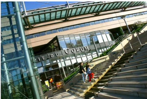
Le Corum: Palais des congrès de Montpellier

L'orientation, un droit de l'Homme ou du citoyen ? Comment le conseil en orientation peut-il contribuer à construire des citoyens concevant leur développement personnel en relation avec celui d'autrui et du bien commun ? Quelles politiques publiques mettre en place à cet effet ?