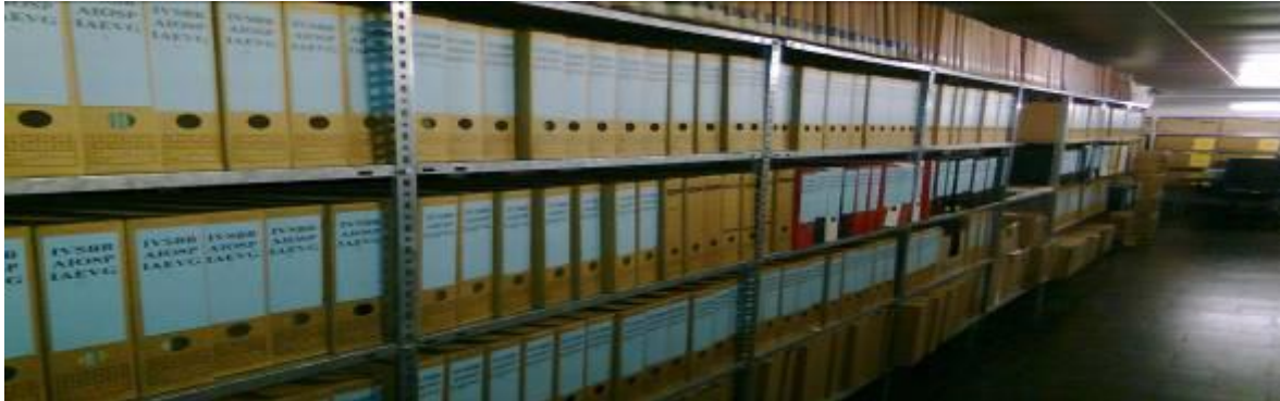
Les archives de l'AIOSP

pour l'emploi allemand) de Mannheim, en Allemagne, l'université où la dernière conférence de l'AIOSP s'est tenue.