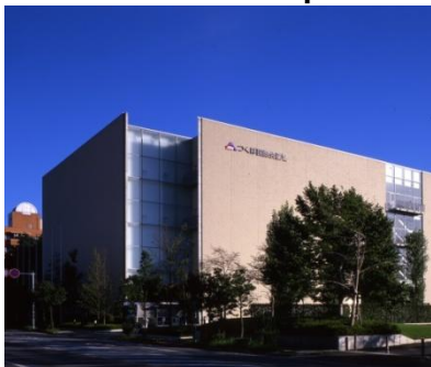
Sitio del Congreso, EPOCHAL TSUKUBA

El próximo congreso de la IAEVG se realizará en Tsukuba del 18 al 21, de Septiembre de 2015, Japón con el tema: " Reestructurando carreras sobre Fuerzas inesperadas ".