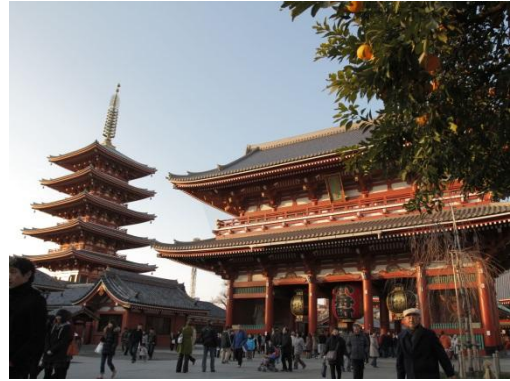
Foto en Asakusa

Después del Congreso: Japón tiene muchos atractivos para ver. Disfrute su congreso y tenga una feliz estancia!