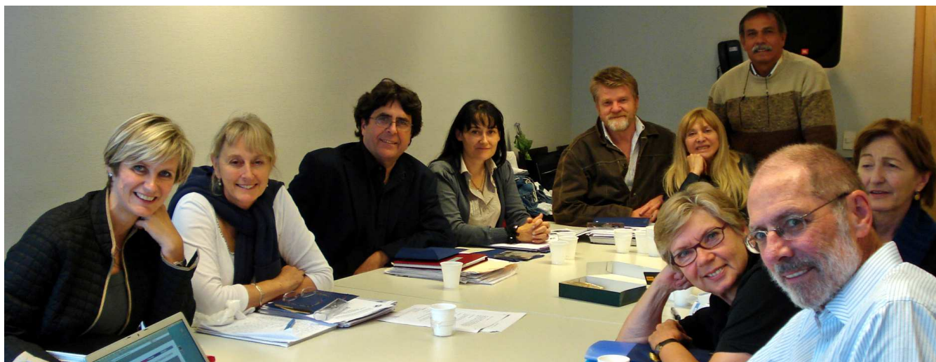
Reunión del equipo Directivo en Buenos Aires el domingo, 21 de Septiembre

Se hicieron tres reuniones en Buenos Aires durante la Conferencia Anual de esta ciudad, Reunión Ejecutiva, de Corresponsales Nacionales y Reunión de Directivos